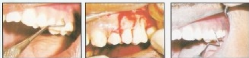
Post & Core